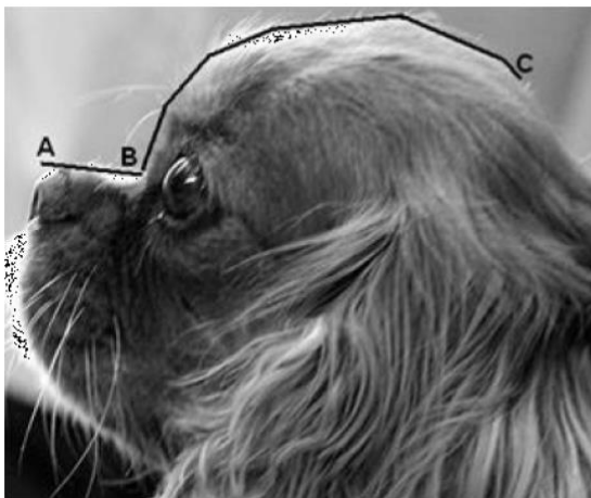
Abb. 2 Verhältnis Schnauzen-/Schädellänge (aus Packer, 2014: 18)

(Anm.: ziehen Sie zur Beantwortung dieser Frage die Abb. 2 + 3 und die Erläuterungen heran.)